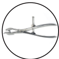
Pince Apti Forte